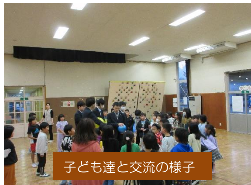
子ども達と交流の様子

「ころころドッチボール楽しかったです。来年も来てください」など、心のこもった言葉が多く寄せられました。図書委員の皆さん、大変お疲れさまでした。